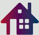
ካመምዎት በቤትዎ ይቆዩ።