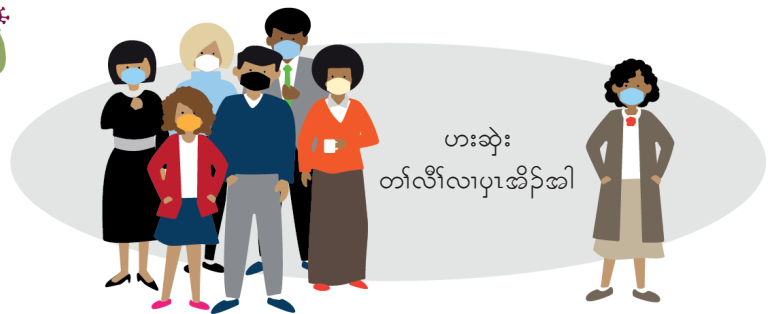
ဟးဆဲး တံာ်လီာ်လာပုာ်အိာ်အါ