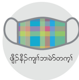
ဖျါနီာ်ကျါဘဲာ်တကွာ်

နမ့တဆဲးကသံာ်ဒီးသဒါလာပုာ်ပုာ်ဘာ် ဒီးမ့အိာ်ဘူးဒီး ပုာ်တဂါလာအိာ်ဒီး COVID-19 န့ာ်, အိာ်လာဟံာ်ဒီး အိာ်ယံးလီာ်သးဒီးပုာ်အဂါတကွာ်. လာနကအိာ်တဆုာ်အဂီာ်, တံာ်ဆါကတီာ်ကယံာ်ဝဲ တုာ်လာ ၁၄ သီ အယံ, ဆဲးသမံသမိးကွာ်နတ်ဆါပနီာ်တဖာ် တကွာ်. တံာ်ဆါပနီာ်တဖာ် မ့ဆဲးအိာ်ဖျါထီာ်န့ာ်, ဆဲးကျိးပုာ်ဟ့ာ်လီာ်န့ာ်ဆုာ်ချ, တံာ်ကွာ်ထွဲတကွာ်.